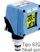
Tipo 8326 Nivel por presión hidrostática