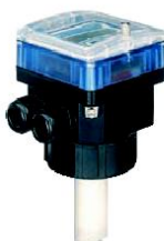
Tipo 8025 Rodetes inserción con electrónica