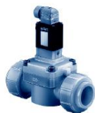
Tipo 142 Fluidos agresivos, 2/2, hasta DN50