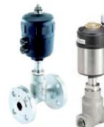
Tipo 2012/2101 Asiento recto