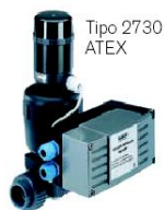
Tipo 2730 ATEX