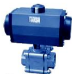
Tipo 2655 Bola neumática