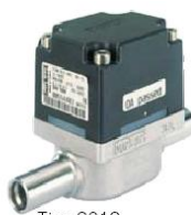
Tipo 8012 Rodetes, OEM (low cost)