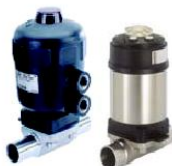
Tipo 2031/2103 Diafragma