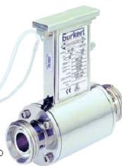
Tipo 8055 Sensor electromagnético