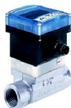
Tipo 8032 Rodetes + display + relé alarma