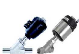
Tipo 2000/2100 Asiento inclinado