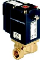
Tipo 2833 Acción directa DN 0,8-4,0 mm