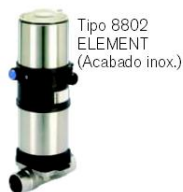
Tipo 8802 ELEMENT (Acabado inox.)