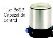
Tipo 8693 Cabezal de control