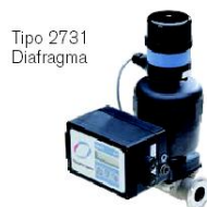
Tipo 2731 Diafragma