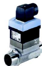
Tipo 8030 Rodetes compacto Versión ciega