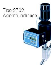
Tipo 2702 Asiento inclinado