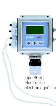
Tipo 8055 Electrónica electromagnético