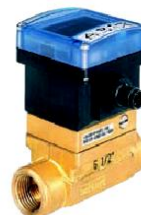
Tipo 8039 Rodetes, óptico