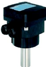
Tipo 8041 inserción electromagnético Versión ciega