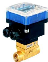
Tipo 8035 Rodetes compacto con electrónica