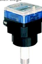
Tipo 8045 inserción electromagnético con electrónica